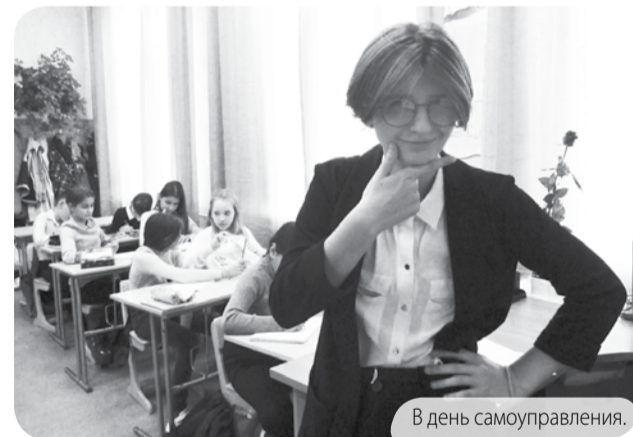
В день самоуправления.

День завершился проведением квиза «Учителями славитесь Россия!» для команд активных волонтёров-учителей и молодых педагогов школы.