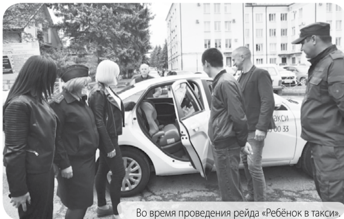
Во время проведения рейда «Ребёнок в такси».

Участники акции при вызове такси сообщали диспетчеру, что среди пассажиров во время перевозки будет ребёнок. Приехавшие на вызов автомобили проверя-